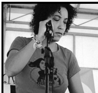
m., porte-plume/voix pour O.P.A

Parallèlement ou plutôt simultanément, O.P.A s'est toujours envisagé comme un lieu ouvertement politique , soit par son propos, soit par son environnement, soit par l'information qu'il choisit de diffuser.